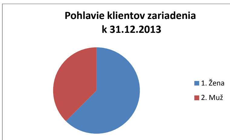
Graf č. 1: